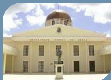
CAMPUS DE SOBRAL