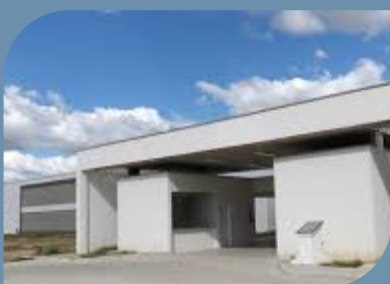
CAMPUS DE RUSSAS