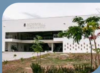
CAMPUS DE CRATEÚS