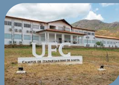
CAMPUS DE ITAJAÉ