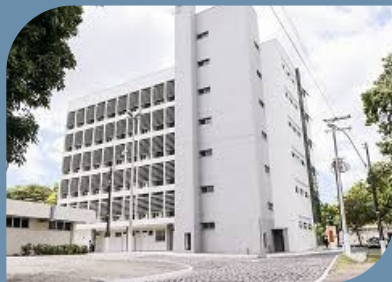
CAMPUS DO PICI E PORANGABUÇU