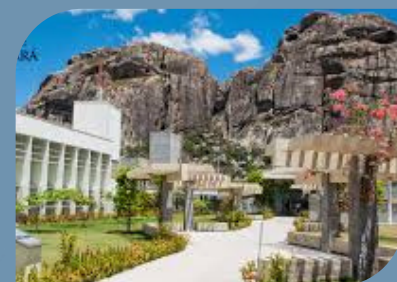
CAMPUS DE QUIXADÁ