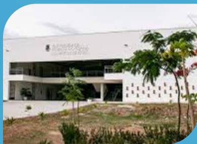
CAMPUS DE CRATEÚS