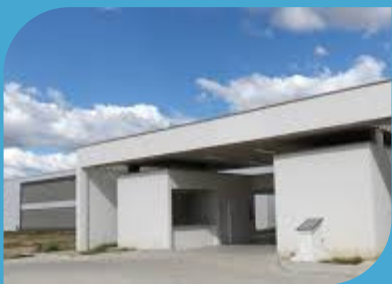
CAMPUS DE RUSSAS