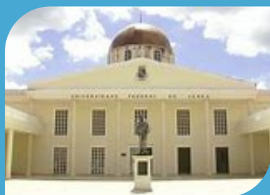
CAMPUS DE SOBRAL