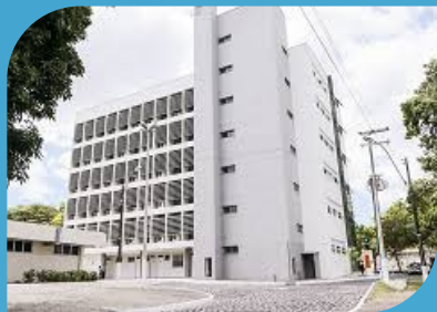
CAMPUS DO PICI E PORANGABUÇU