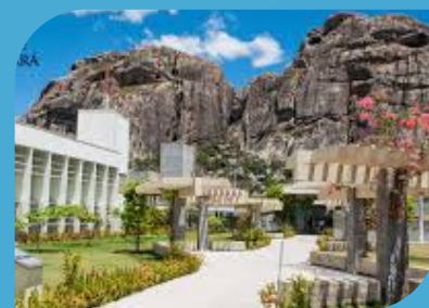
CAMPUS DE QUIXADÁ