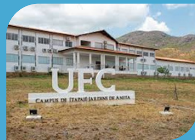
CAMPUS DE ITAPAJÉ